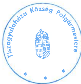
Mikó Zoltán polgármester